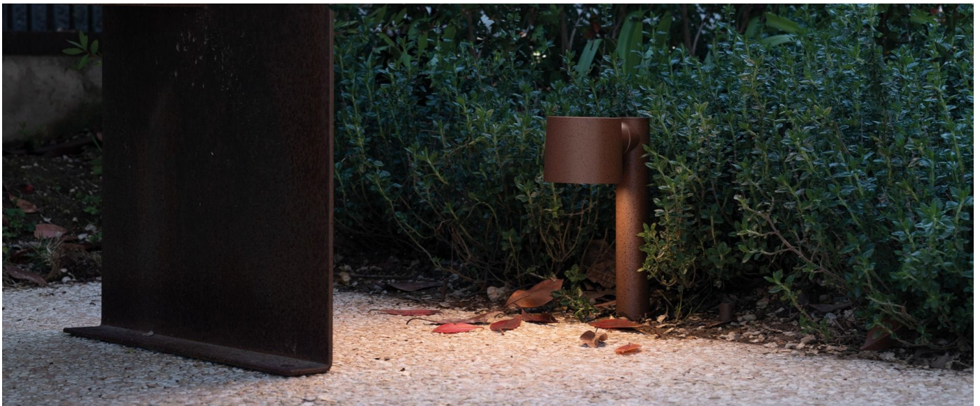
Immagine di montaggio: